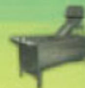
TINAS DE COCIMENTO