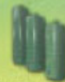
CALDERAS DE AGUA